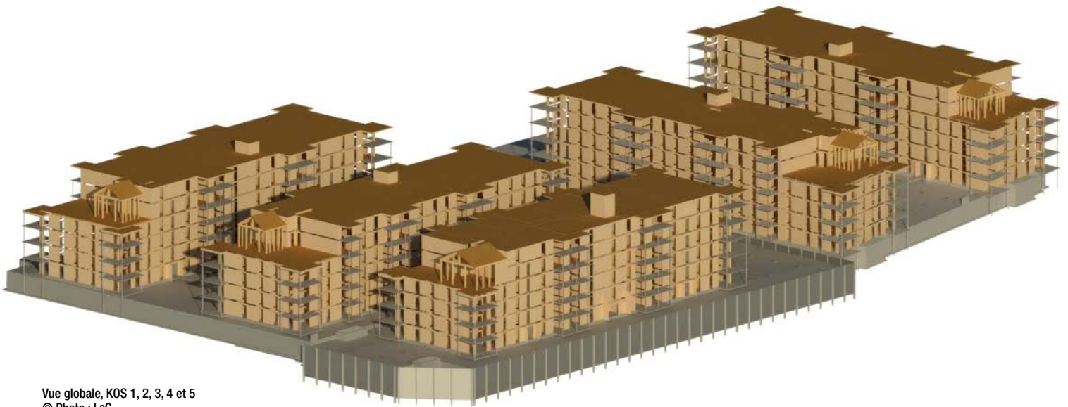
Vue globale, KOS 1, 2, 3, 4 et 5

À l'angle de l'avenue Chauveau et de la rue Coursol, à Québec, se dressent les cinq bâtiments de six étages du KOS. Inspiré de la Scandinavie, ce projet de 349 unités, compte parmi les plus importants ensembles résidentiels d'habitation en ossature légère en bois au Québec. Les bâtiments se distinguent aussi par leur solarium en bois massif en toiture. Le KOS, est le résultat du cumul d'expertises du promoteur LOGISCO et des ingénieurs en structure de L2C Experts-Conseils qui, chacun, ont conçu et construit quelques dizaines de bâtiments de cinq ou six étages en ossature légère en bois.